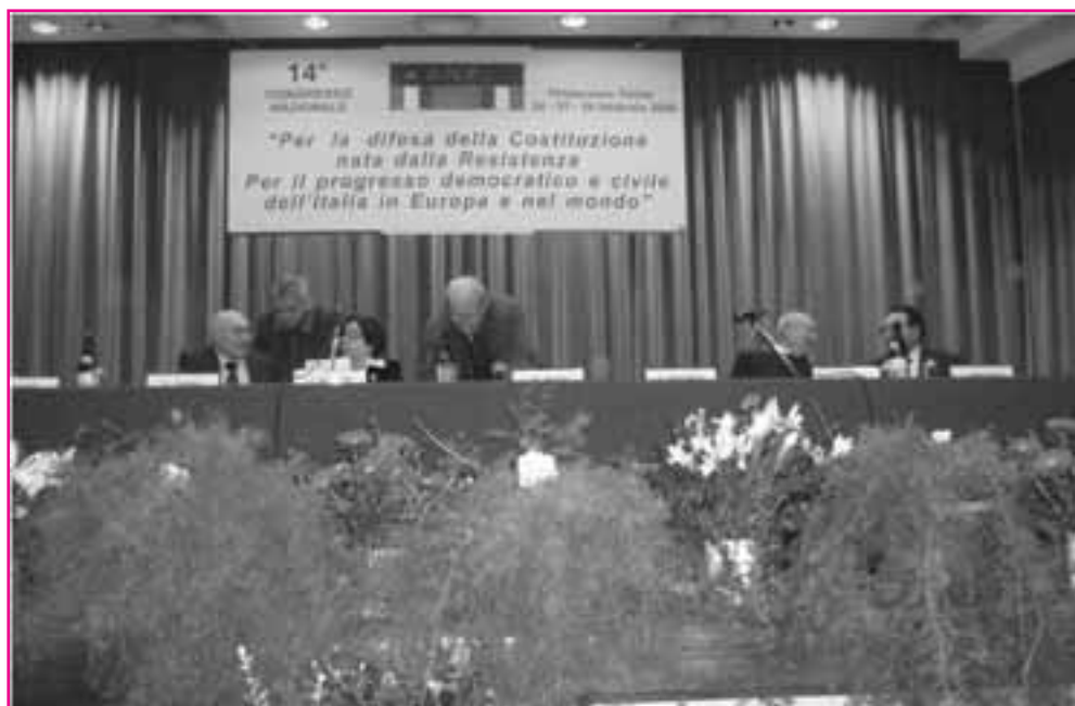
Chianciano. Il tavolo della presidenza al XIV Congresso Anpi

Nota dolente è stata la poca attenzione che gli organi di stampa nazionali hanno dato al Congresso, ingiustificata, soprattutto da parte dei mezzi d'informazione in teoria più sensibili alle tematiche della Resistenza. Se pensano che tutto questo sia già storia passata si sbagliano. L'Antifascismo e la Resistenza sono tematiche mai state così attuali negli ultimi sessant'anni, e il congresso dell'ANPI ne ha dato fortemente conferma.