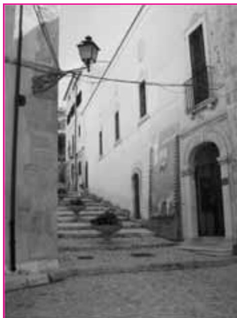
Uno scorcio di Pescina, paese natale di Silone

Nel maggio del 1927 Silone partecipò a Mosca, insieme con Togliatti, ad una sessione straordinaria dell'esecutivo allargato dell'Internazionale comunista alla presenza di Stalin. Ecco il testo delle fasi più significative dell'avvenimento narrate dallo stesso Silone in Uscita di sicurezza , stralciate qua e là per ovvie esigenze di spazio. "Alla prima seduta...avemmo l'impressione di essere arrivati